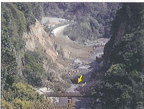
写真2は、同位置からのアップである。両岸の工事用仮設道路や、奥の1本目の工事用仮橋も右岸側（写真では左側）が崩壊した土砂で埋まり、白川の流れの一部がせき止められ、左岸側の仮排水路トンネル（工事中）に流れ込んでいる。

国土交通省は「ダム予定地の岩盤は十分な強度がある」と主張してきた。もしダム完成後にこの地震が起きているとしたら、ダム本体の両岸の地盤が崩れていたわけであり、ダムの施設が損壊していた恐れもある。